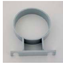
集水タンクホルダー